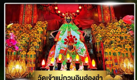
วัดเจ้าแม่กวนอิมอ่องอำ